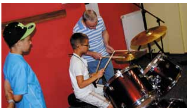
Nauka gry na perkusji - Pracownia Muzyczna

niej Kapel, który cieszył się ogromną popularnością wśród każdego środowiska radomskich.