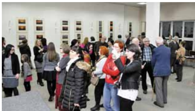
Otwarcie wystawy fotograficznej Od wschodu do zachodu

i dopasowany do potrzeb społeczności lokalnej oraz ogólnoradomskiej wciąż rośnie, co ostatnio pokazał Tur-