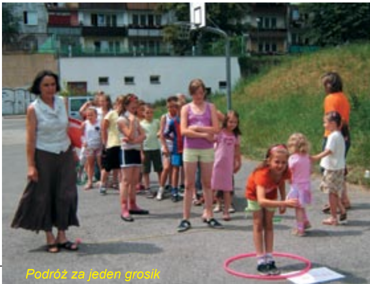
Podróż za jeden grosik

W czwartki młodzież z osiedla ma możliwość grać w kręgle