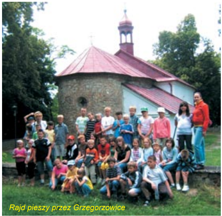
Rajd pieszy przez Grzegorzowice

W minionym miesiącu oglądaliśmy również wystawy przygotowane przez Muzeum Okręgowe w Radomiu, przyglądaliśmy się pracy Straży Pożarnej oraz braliśmy udział w zajęciach przygo-