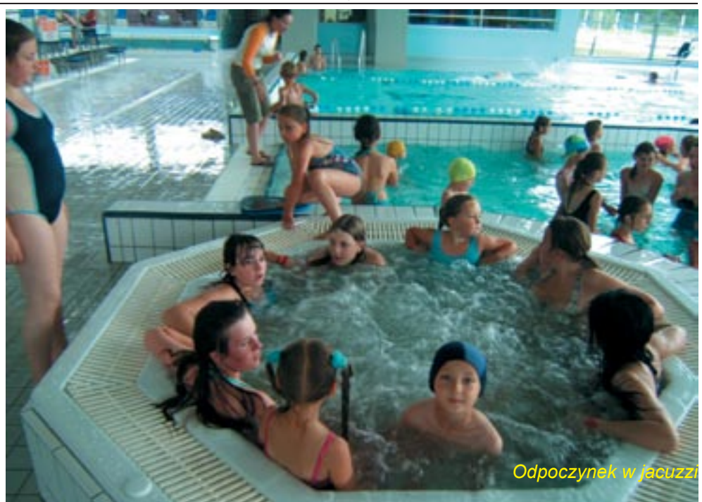
Odpoczynek w jacuzzi