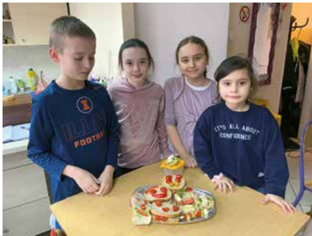
Warsztaty kulinarne w Kubusiu

Dużym powodzeniem cieszył się również zorganizowany konkurs plastyczny pt. „Kolorowy bałwan”.