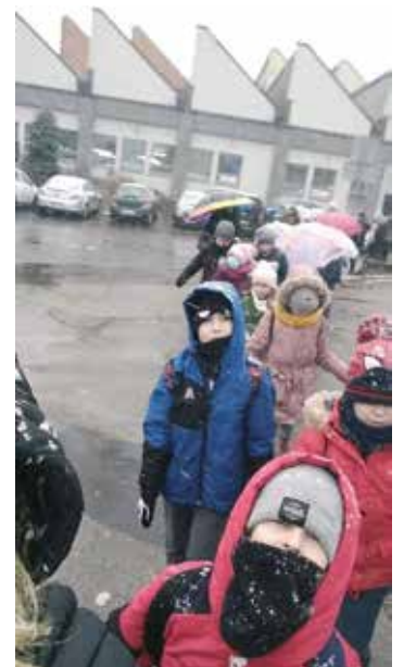
Wracamy z kina