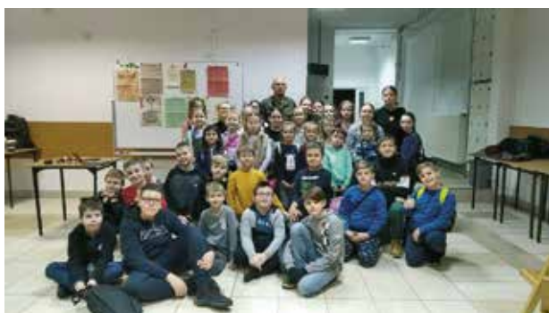
Spotkanie z historią