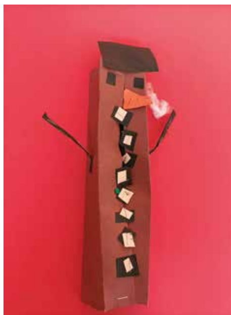
1 miejsce w konkursie plastycznym Szymon Sikora Kubuś