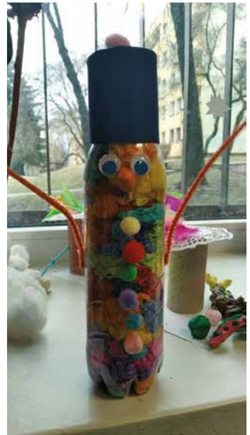
1 miejsce w konkursie plastycznym Karolina Jasińska